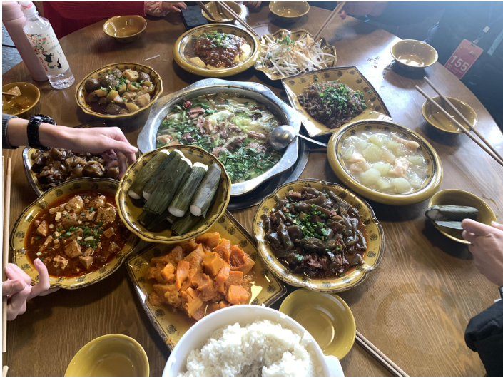
（乐山午餐翘脚牛肉实拍图）

翘脚牛肉：四川省乐山苏稽一道源远流长的汉族名菜。跷脚牛肉几经发展，汤味愈加讲究。在传统汤味的基础上，新添了胡椒、味精、芽菜等现代佐料，更趋科学营养。已形成汤色碧清、香味绵长、牛杂脆嫩、吃法多样的四大特色。跷脚牛肉是乐山的非物质文化遗产，乐山大街小巷中绝对少不了的一道美味，跷脚牛肉汤汁醇厚，味美鲜香。外地人在乐山吃过了跷脚牛肉的，无不竖起大拇指。