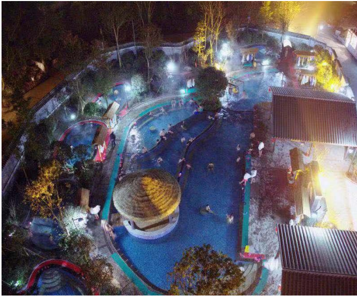
源头酒店温泉池全景