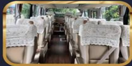
可升级 20人头等舱小团