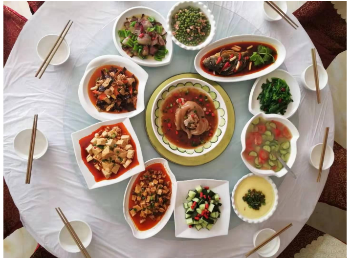
（峨眉山午餐实拍图）