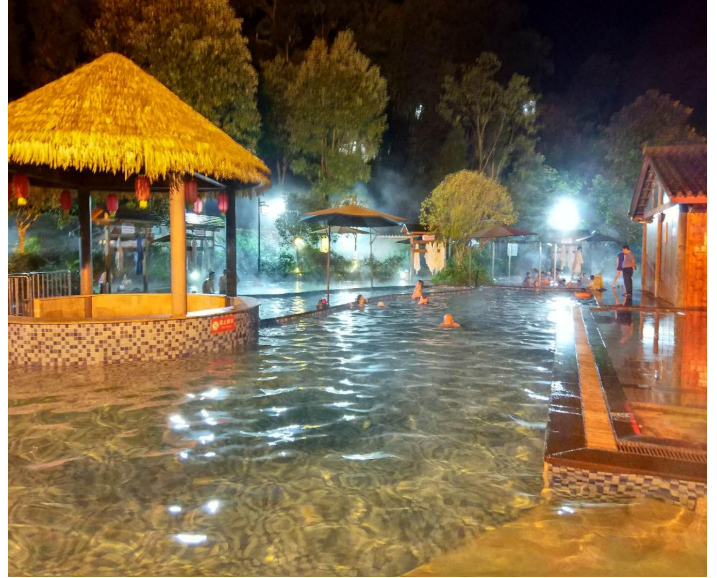
源头酒店温泉池一隅